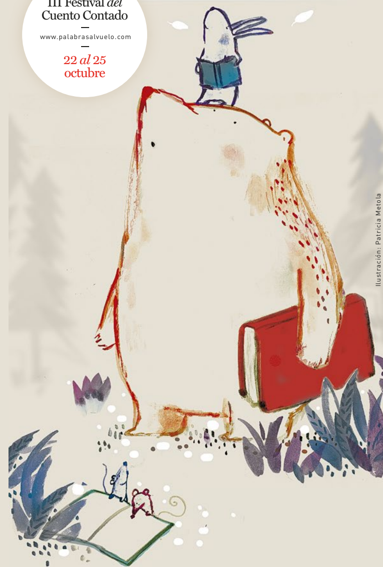
Ilustración: Patricia Metola